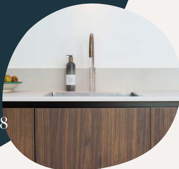
ONTDEK JE KEUKEN